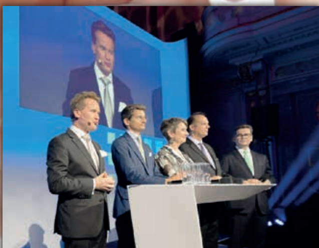
TAG DER INDUSTRIE Gelungener Auftakt der Industriestrategie 2023

Österreichische Post AG, MZ 03Z034897 M Vereinigung der österreichischen Industrie, Schwarzenbergplatz 4, 1030 Wien