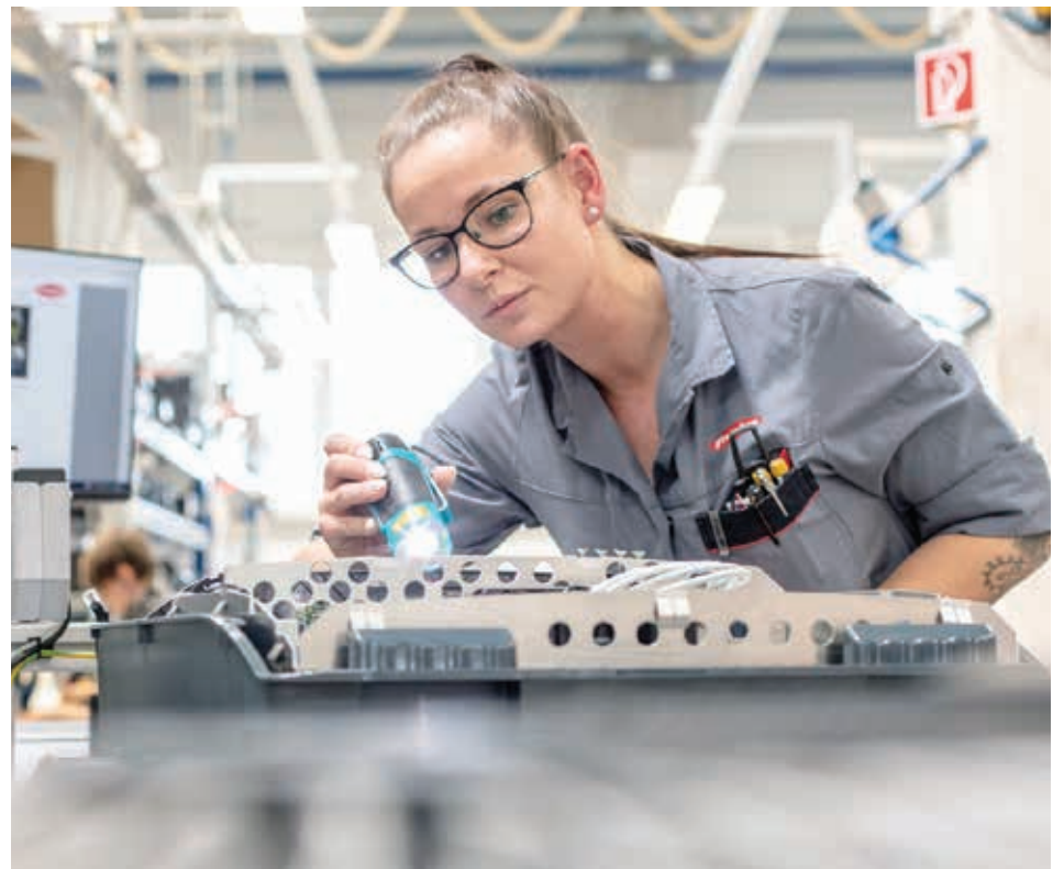
In der Industrie ist der Bedarf an hoch qualifizierten Mitarbeiterinnen und Mitarbeitern hoch.