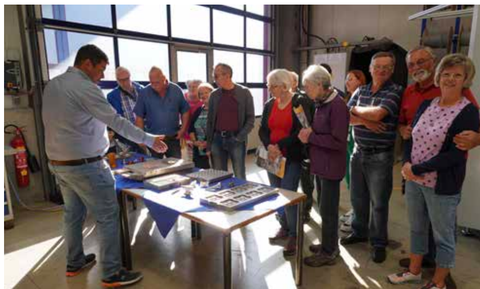
Auch Angehörige von Mitarbeiterinnen und Mitarbeitern und umliegende Nachbarinnen und Nachbarn nutzten die Tage der offenen Tür, um einen Blick in die Betriebe zu werfen, wie hier bei der Bühler Metall- und Kunststoffwaren Erzeugungs GesmbH in Heidenreichstein.