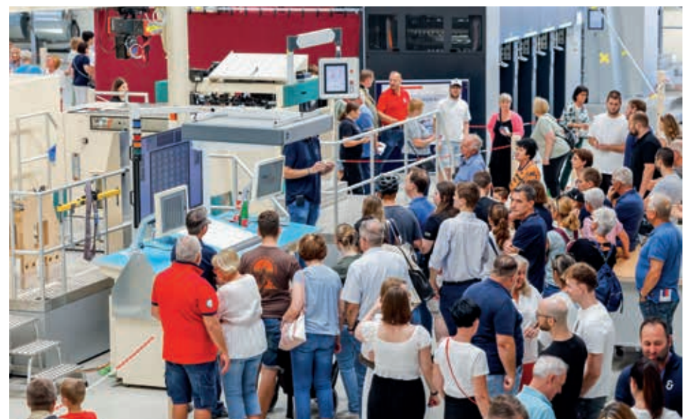
Großer Andrang bei den Führungen bei Koenig & Bauer in Maria Enzersdorf im Zuge des 175-Jahres-Firmenjubiläumsfests.