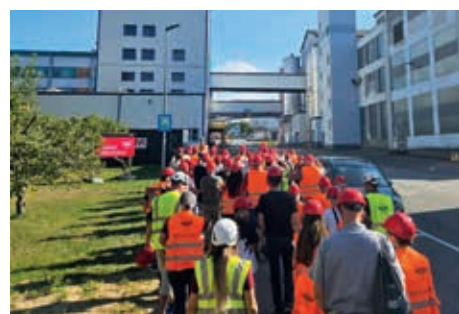
Das Interesse an Werksführungen in den Industriebetrieben war sehr groß – wie hier bei Agrana Stärke in Gmünd.