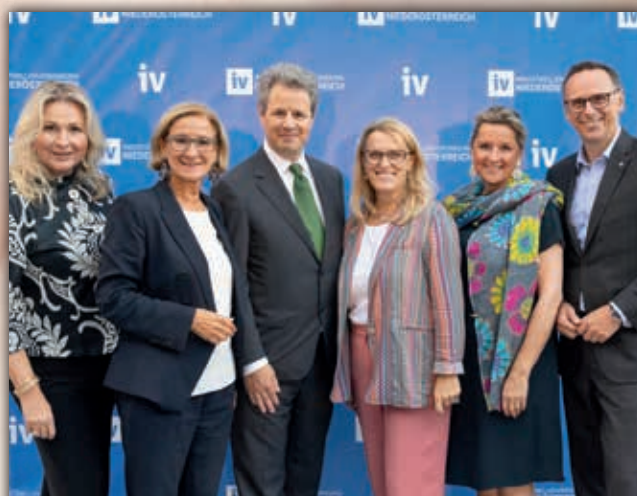
NIEDERÖSTERREICH Rund 400 Gäste beim Sommerausklang der IV-NÖ