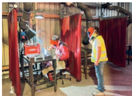
Bei Baumit in Waldegg konnten Jugendliche Lehrberufe selbst ausprobieren.

gen ist auch ein starkes Zeichen für den Zusammenhalt der Industrie auch in schwierigen Zeiten.“