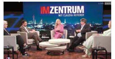
Es folgten zahlreiche Interviews und TV-Auftritte, darunter in der ORF-Sendung „Im Zentrum“, bei „Talk im Hangar 7“ bei Servus TV oder bei oe24.tv.