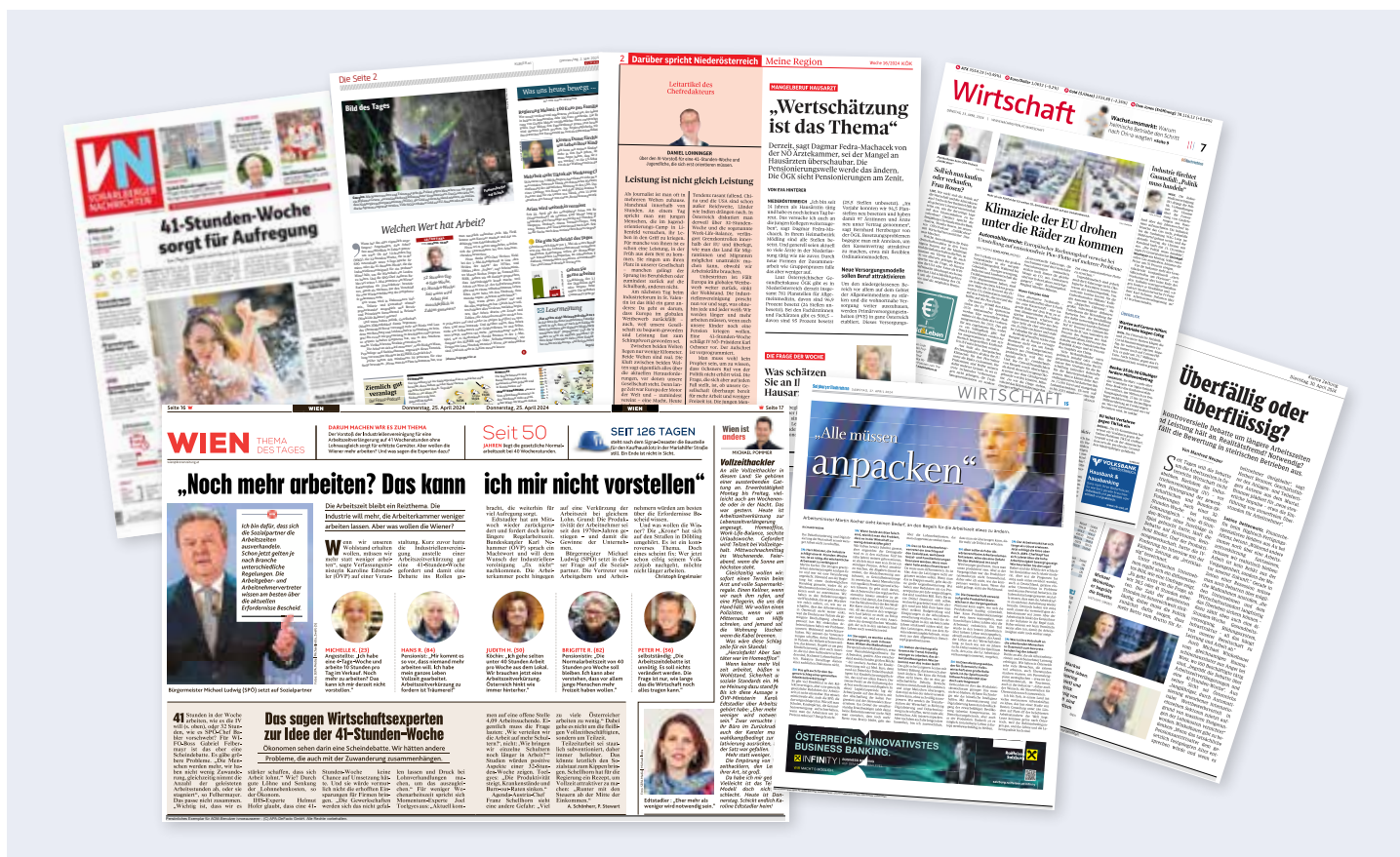
Das Thema Arbeitszeit wurde in verschiedenen Medien breit diskutiert, zahlreiche Experten, Politiker, Interessenvertreter und Minister meldeten sich zu Wort.