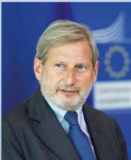
EU-Kommissar Johannes Hahn.

Aus meiner Sicht gibt es zwei Wege, um die Wettbewerbsfähigkeit der EU budgetär sicherzustellen: Entweder die Mitgliedstaaten zahlen höhere Beiträge in das EU-Budget oder man ändert die derzeitige Struktur des EU-Budgets. Letzteres würde konkret bedeuten, dass man in Hinblick auf die Mittelausstattung die