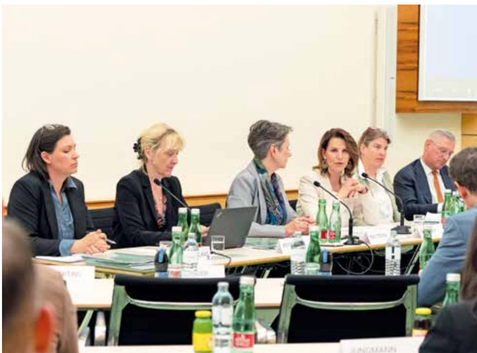
Podiumsdiskussion beim Kick-off der neuen Task Force

Die Stiftung hat sowohl eine wirtschaftliche als auch naturwissenschaftliche Ausrichtung. Sie unterstützt Studien zur Kompetenzbeschaffung und zur Vertiefung der jeweiligen fachlichen Fremdsprachenkenntnisse an internationalen Spitzeninstituten in Bildung, Wissenschaft und Forschung.