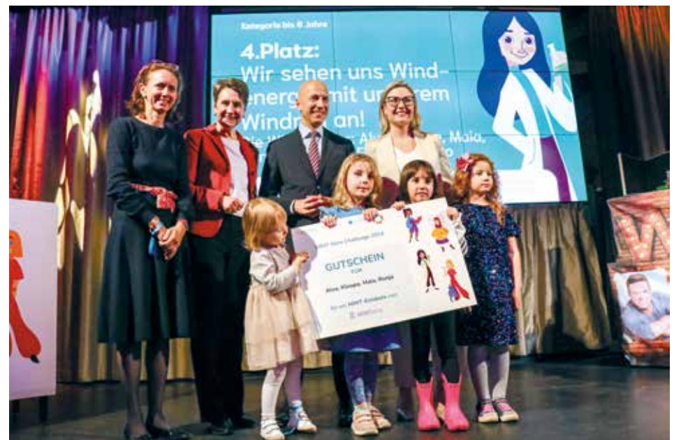
Junge MINT-Talente auf der Bühne der MINT Girls Challenge.