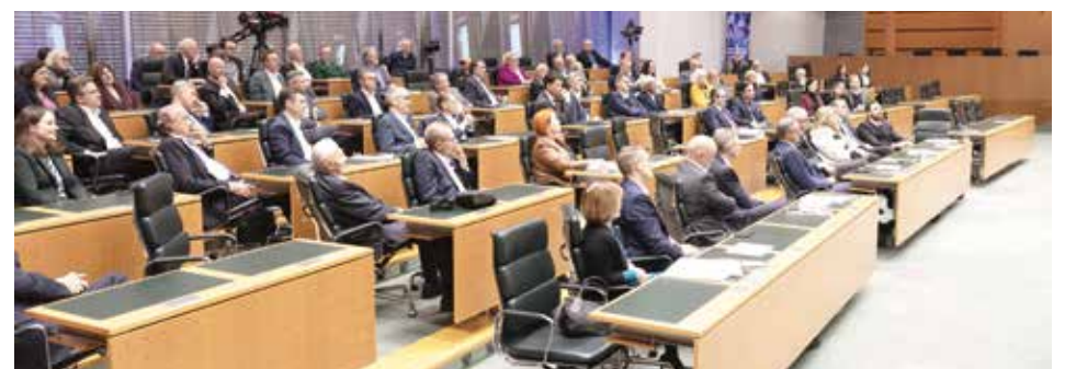
Anstelle von Mandatären und Landesräten durften während der Ordentlichen Vollversammlung die IV-NÖ-Mitglieder und Gäste im Landtagssitzungssaal in St. Pölten Platz nehmen.