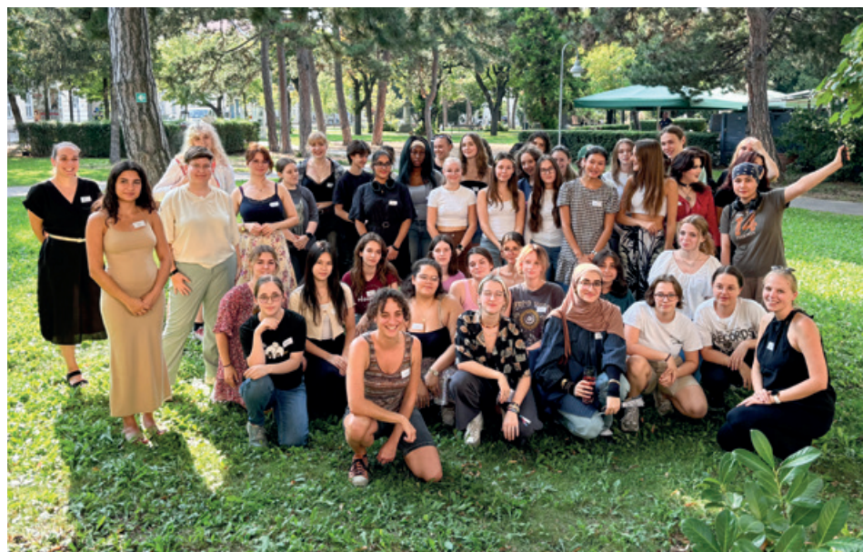
HTL-Schülerinnen aus „HTL-Girls Grow & Glow“.

So wurde auf Initiative der IV ein Kooperationsprojekt mit der MINTality-Stiftung, dem HTL-Direktorenverband und HTL-Schülerinnen gestartet. Ziel von „HTL-Girls Grow & Glow“ ist es, interessierte HTLs durch gezielte Interventionen stärker zu „Schulen der Mädchen“ zu machen und damit künftig mehr interessierte weibliche Talente anzuziehen. Operativ unterstützt durch die MINTality-Stiftung wird die HTL dabei in einer ersten Phase von ihren eigenen Schülerinnen unter die Lupe genommen: Wer oder was hat die Schulwahl beeinflusst? Wie wird das