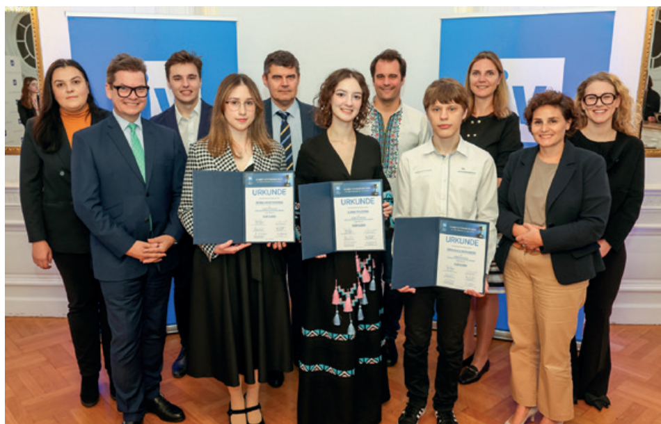
Die Stipendiaten bei der Verleihung im Haus der Industrie.

Das Stipendium steht unter dem Motto „Praktischer Wissenstransfer im MINT-Bereich“ und wurde diesmal an drei junge Talente vergeben.