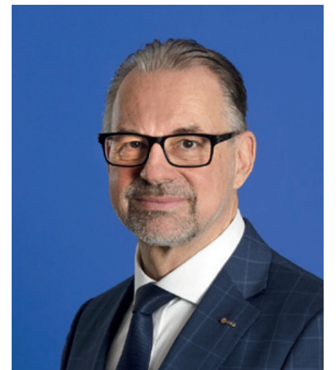
Der Österreicher Josef Aschbacher ist seit März 2021 Generaldirektor der ESA – die Europäische Weltraumorganisation (European Space Agency, ESA), mit Sitz in Paris, ist eine internationale Organisation 23 europäischer Staaten für die Koordinierung und den Betrieb gemeinsamer Raumfahrtaktivitäten.

Österreich hat eine gute Weltraumstrategie, die durch den Nationalrat beschlos-