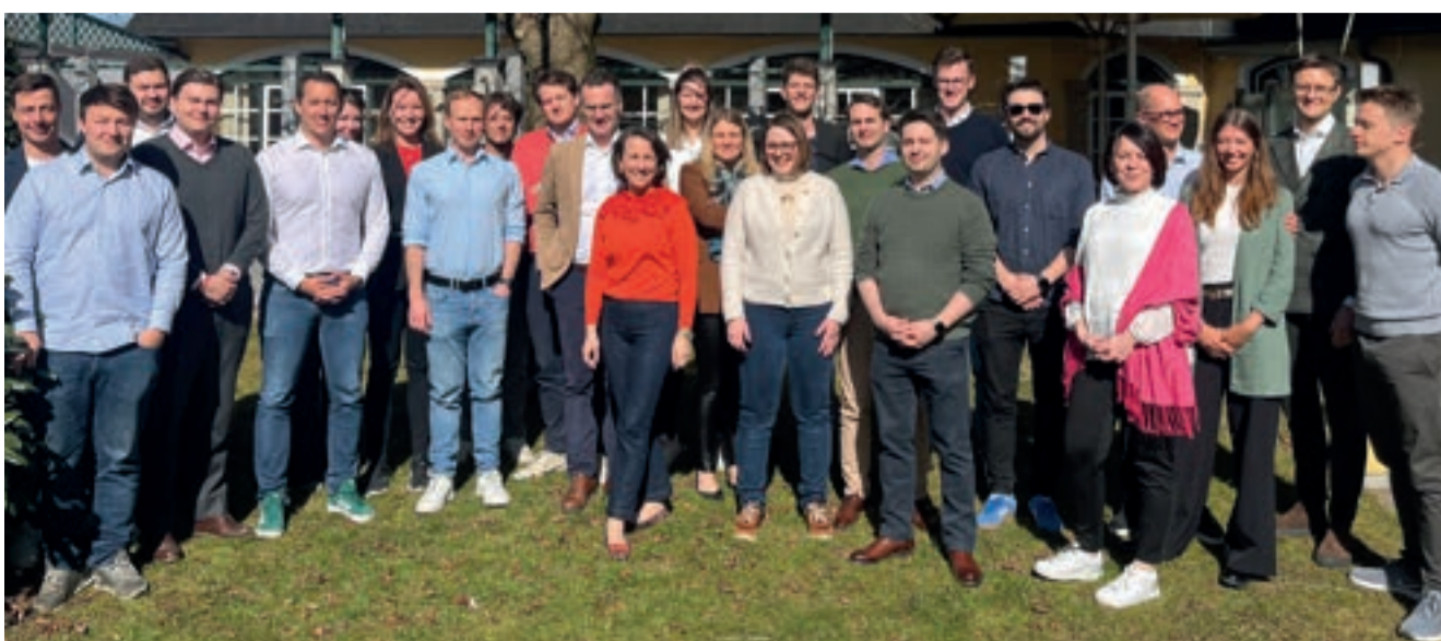
Der JI Leaders Circle.